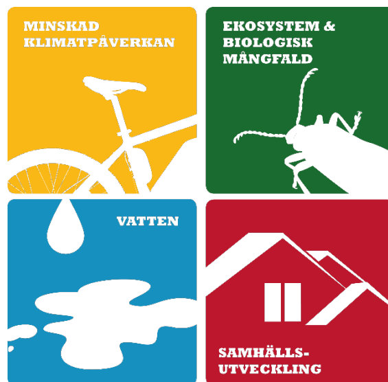
Figur 1. De fyra åtgärdsprogrammen som tillsammans omfattar åtgärder för länets prioriterade miljö- och samhällsutmaningar inom Färdplan för ett hållbart län.

En av rådets främsta uppgifter är att vara aktiv i framtagande och genomförande av åtgärdsprogrammen inom Färdplan för ett hållbart län. Rådet är också en viktig arena för fördjupad analys och samsyn kring länets miljö- och samhällsutmaningar. Medlemmar i rådet är kommuner, myndigheter och andra organisationer som genom sin verksamhet har