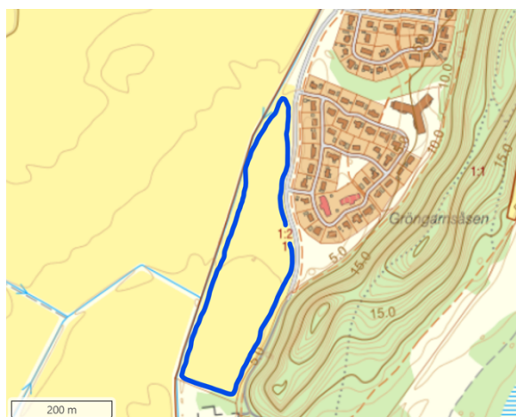
Tidigare utarrenderad åkermark på Gröngarn 1:2. En våtmark kommer att anläggas på norra delen av åkermarken.