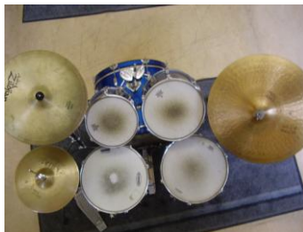
Crashcymbal till vänster